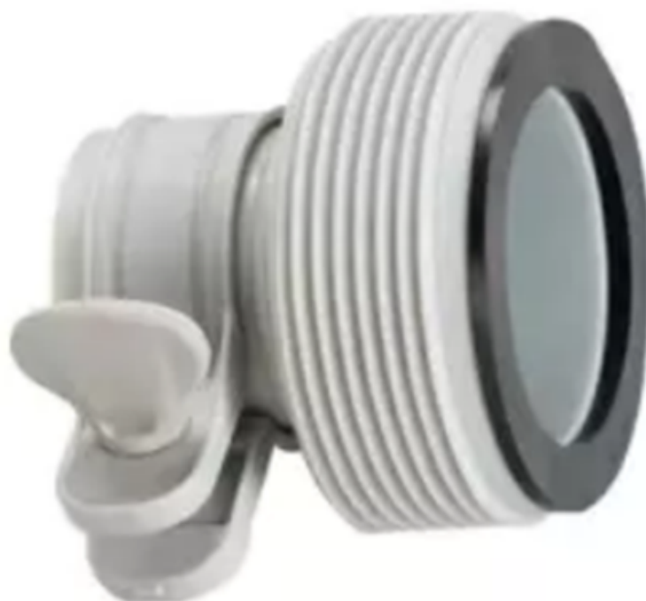
Adaptér pro bazény

Adaptér B: https://www.steinbach-group.com/de/110722-eingezogener-adapter-b-10833de/